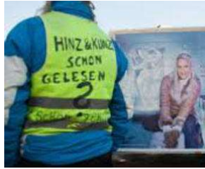
SIE kommt etwas später - aber sie KOMMT !! von Erich Heeder